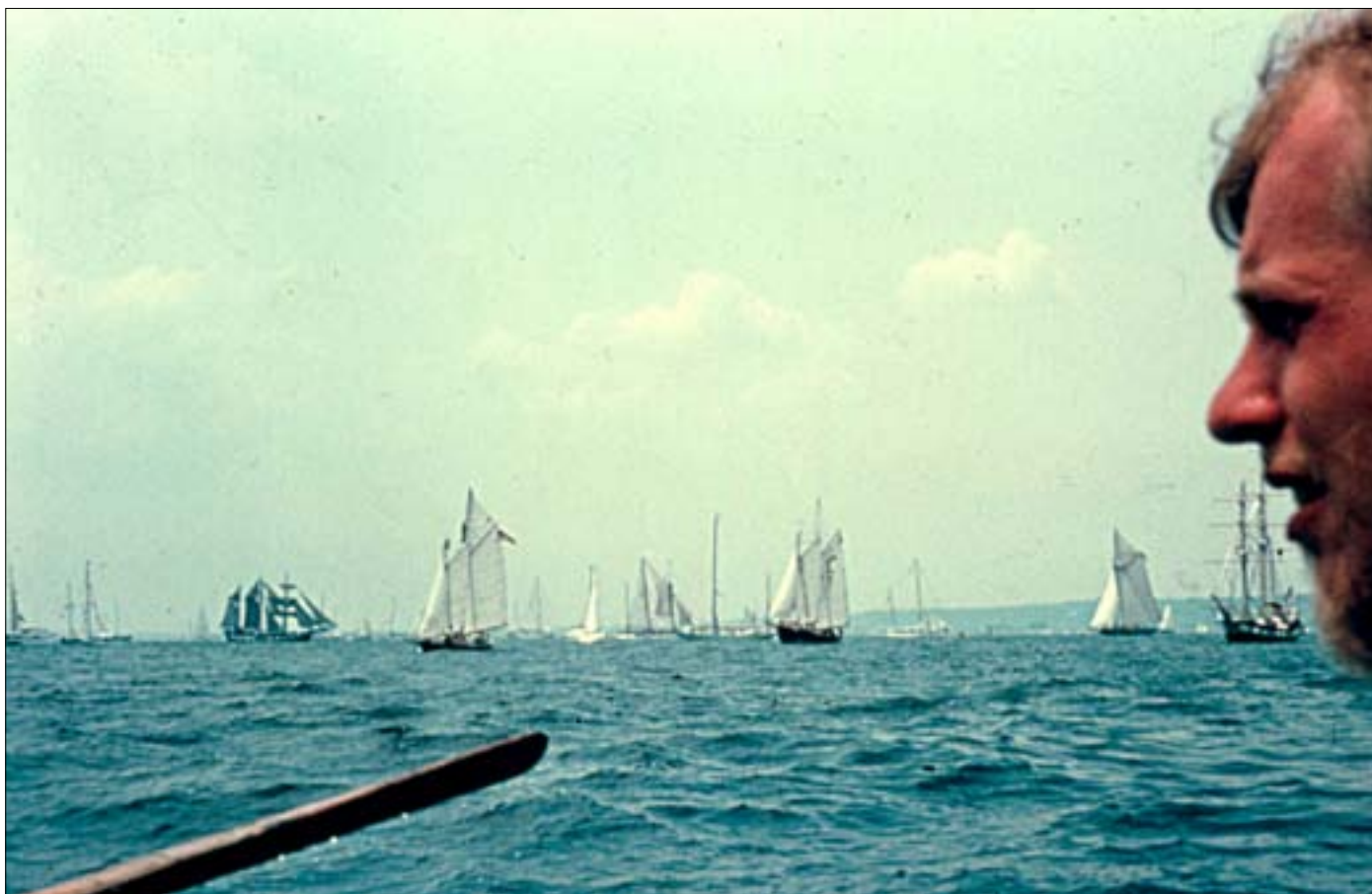
Der var et mylder af historiske skibe