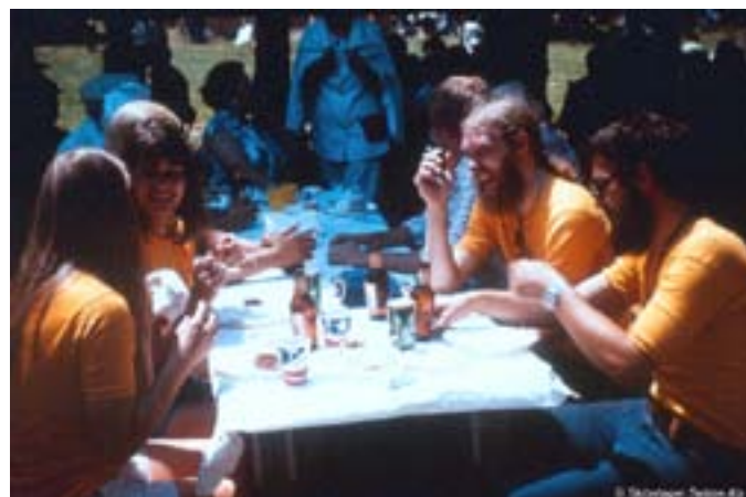
Der var masser af hygge

Da vi kom tilbage var en bunke mennesker samlet om et bål, og Pete Seeger spillede og sang. Det var meget hyggeligt. Senere blev vi opfordret til at synge et par sange skiftevis danske