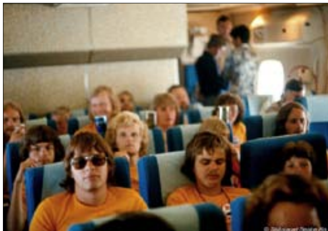
Turen med Jumbo jet fra Kastrup til New York