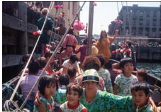
Der var meget at se i den store by