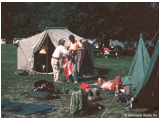
Spejderne havde sørget for telte

Vi havde god tid til morgenmaden, som bestod af "sønderjysk kaffebord" i form af diverse kager, wienerbrød, cola og kaffe. Måltidet sluttede med æg og bacon, og så fik vi alle en stor madpakke med. Vi sejlede ved middagstid mod Croton, og efter ca. 20 min. roning lagde vi til ved en anden yachtklub, hvor vi blev beværtet på bedste måde med store kølige drinks. En af de lokale sejlere fik lov til at sejle med et stykke, da han påstod et kende Hudson floden, som sin egen lomme, (men han anede ikke, der var hul i den).