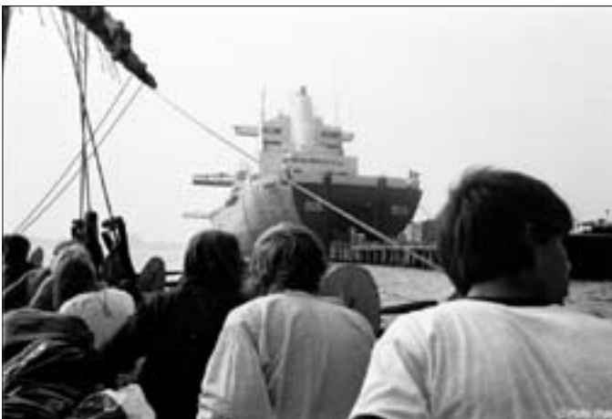
Roturen fra Port Elisabeth