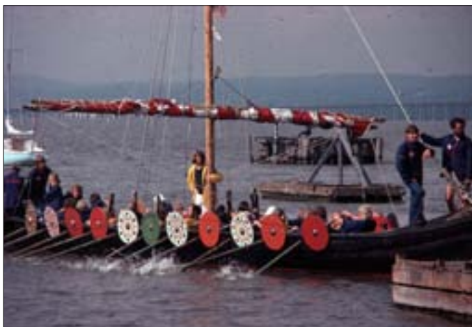
For ronong ind til den gamle mole