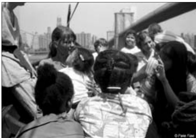
Det var en stor oplevelse for de mange børn

Om aftenen var alle igen inviteret til party i Bach