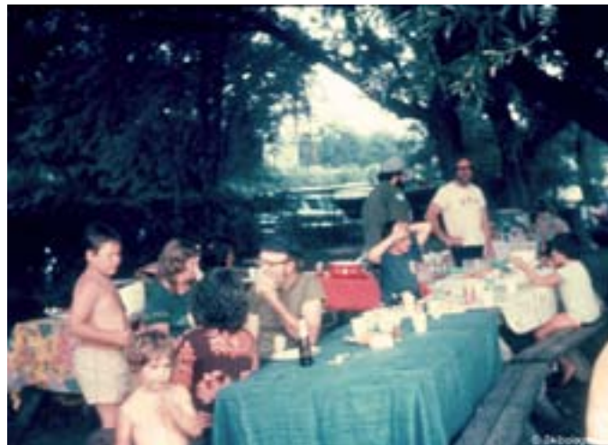
Clearwater havde sørget for mad

Never mind - vi var blevet forsigtige. Vi blev budt velkommen af to spej-dertroppe, der havde rejst en del af deres telte til os, og folk fra Clearwater havde lavet fantastisk fin mad til os: Kylling, majs, kartoffelsalat, masser af kold juice, melon og kaffe, og som vi dog spiste. Vi indordnede os, vaskede os, nogle "indfødte" tilbød os et varmt bad. så nogle gik hjem til Dian og fik bad, medens andre fulgte med andre hjem, hvor de også fik bad.