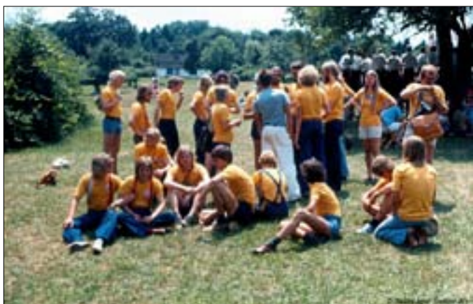
Til dansk / amerikansk Rebildfest

Vi solgte mærker, smykker, postkort o.l. for 70 dollar / 450,- Kr. Sammen med Danmarks Radios drengekor, et ungt orkester og en del amerikanske spejdere deltog vi i åbningshøjtideligheden. Derefter gik det tværs gennem Manhattan på langs til Brooklyn Bridge, hvor SEBBE lå.