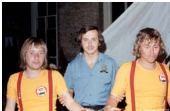
Det ser alvorligt ud, men det var kun for sjov!