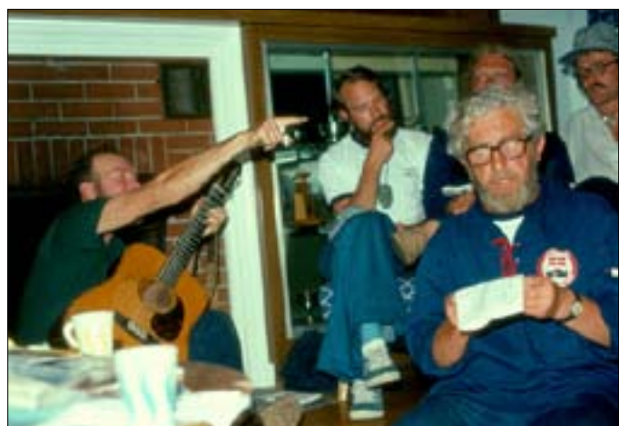
Der var altid sang og musik med Pete

Under hylende sirener og blink blev vi eskorteret af betjentene til en nærliggende park, hvor der var 4. juli fest. Skibslaget blev æresborgere og fik overrakt byens gyldne nøgle, hvorefter C.O. kvitterede med en fin tale og udnævnte borgmesteren til "Member of Honor".