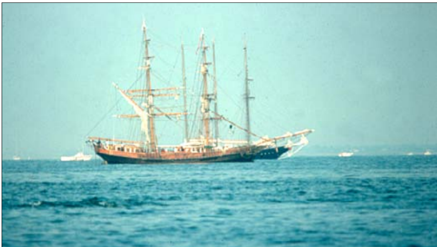
De legendariske skib Unicorn der var blevet brugt i filmen "Roots". Her overnattede vi natten til 4. juli.