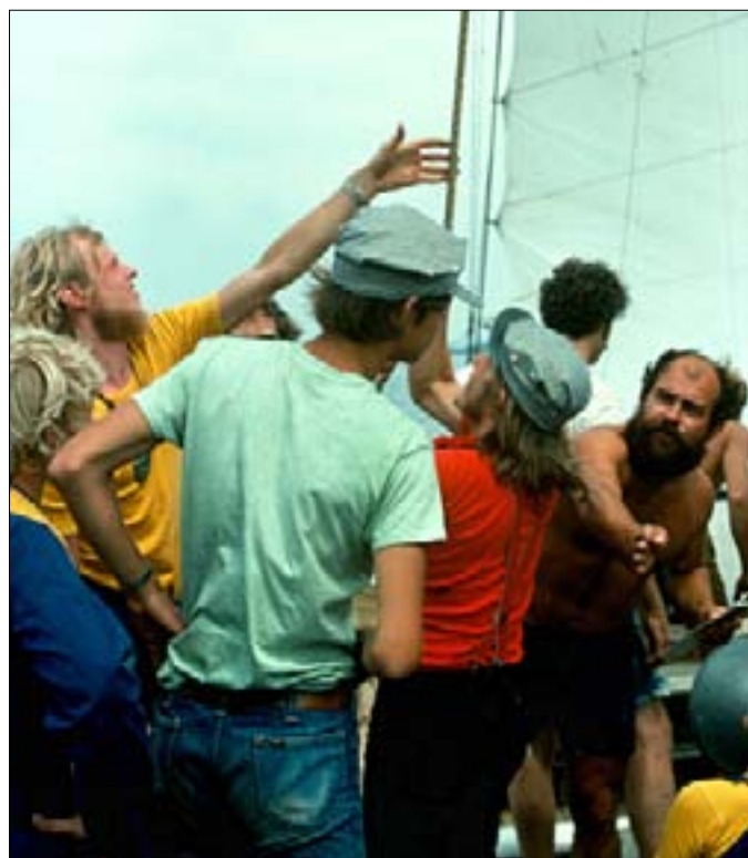
Så skal sejlet hejses og de kan nogle raske vikinger godt hjælpe til med.

En del af os blev så begejstrede for deres ide, at vi på stedet meldte os ind som medlem af Clearwater gruppen. Efter sejlturen var vi inviteret til en Clearwater festival, og da vi kom i land, blev vi transporteret i et lille mini fottog til et område, hvor der for flere år siden havde været verdensudstilling. Ved siden af den store globus var der en del Clearwater folk, der havde lavet et Marked, hvor de solgte ting til fordel for deres arbejde. Der var folkesangere og musik på pladsen, og folk sad rundt omkring på græsset og hyggede sig. Det var et broget skue.