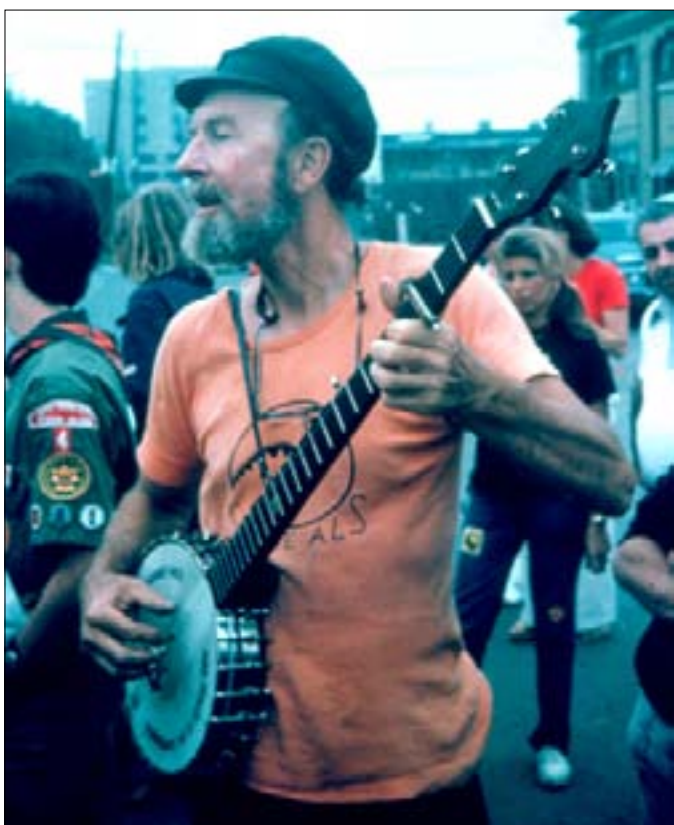
Pete Seeger havde altid banjoen med og spillede hvor vi kom til glæde for mange mennesker.