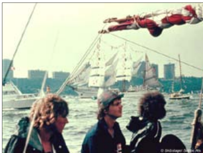
Vejret gjorde at vi var nødt til at bruge motoren

Der var en heksekedel af både og bølger - et under, at der ikke skete alvorligere sammenstød, men alle reagerede hurtigt. Det var meget bittert, da dette skete lige før stedet, hvor der var bygget tribuner op til publikum, og her stod vel ca. 3 million mennesker.