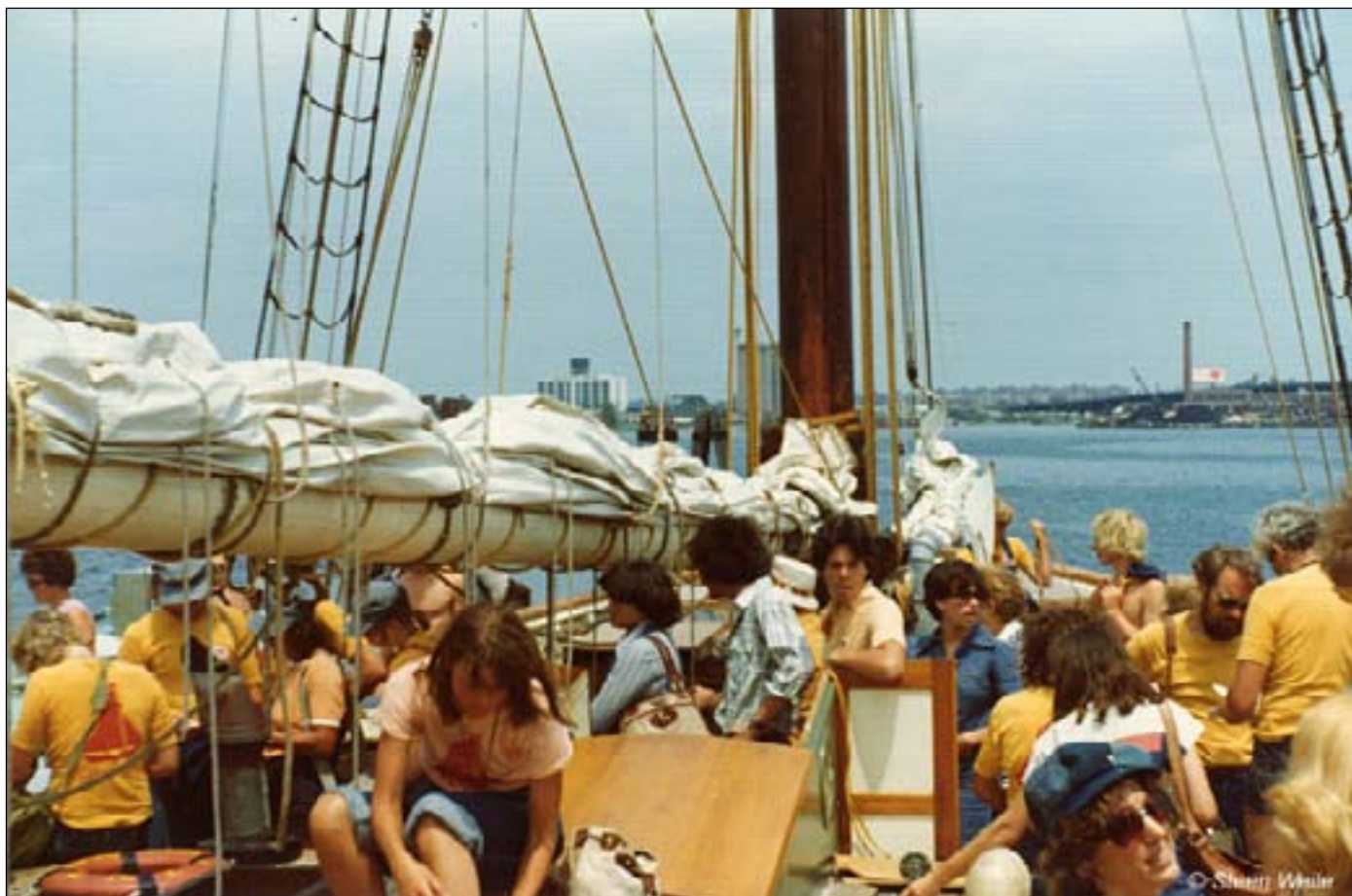
Der hygges og der var også plads til en sang.

Vi fandt en plads under et par skyggefulde træer, og igen kom disse pragtfulde Clearwater folk med store gryder af spændende mad og masser af kold juice.