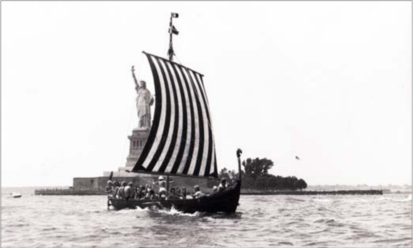
Turen fra Port Elisabeth til Bath Marine Museum forbi frihedsgudinden