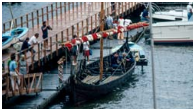
Der kom mange gæster for at se skibet

Blev vi om morgenen kørt ned til Croton igen. Natholdet, der havde hele tiden været vagthold på skift om bord, havde fået morgenmad af en venlig amerikaner. Båden blev stuvet i en fart, for det så ud til regn. Vi sejlede for sejl mod Nyack. Mange mennesker var på kajen, og jubelen var stor. Efter ca. en times sejlads brød uvejret løs, og vi måtte lade sejlet gå ned og starte motoren. Da vi var nået halvdelen af vejen til Nyack, brækkede planken, der holdt motoren, og vi måtte ro i ca. 1 1/2 time. Ved ankomsten til Nyack var vi lidt forundret over, at der ingen mennesker var for at modtage os. Vi gik i land og fandt ud af, at det var på det forkerte sted, og at vi var kommet en time for tidligt, så vi blev liggende der. En del af os slog et slag op i byen.