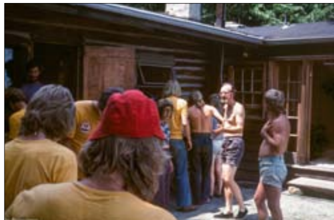
Fint vejr og fuld aktivitet