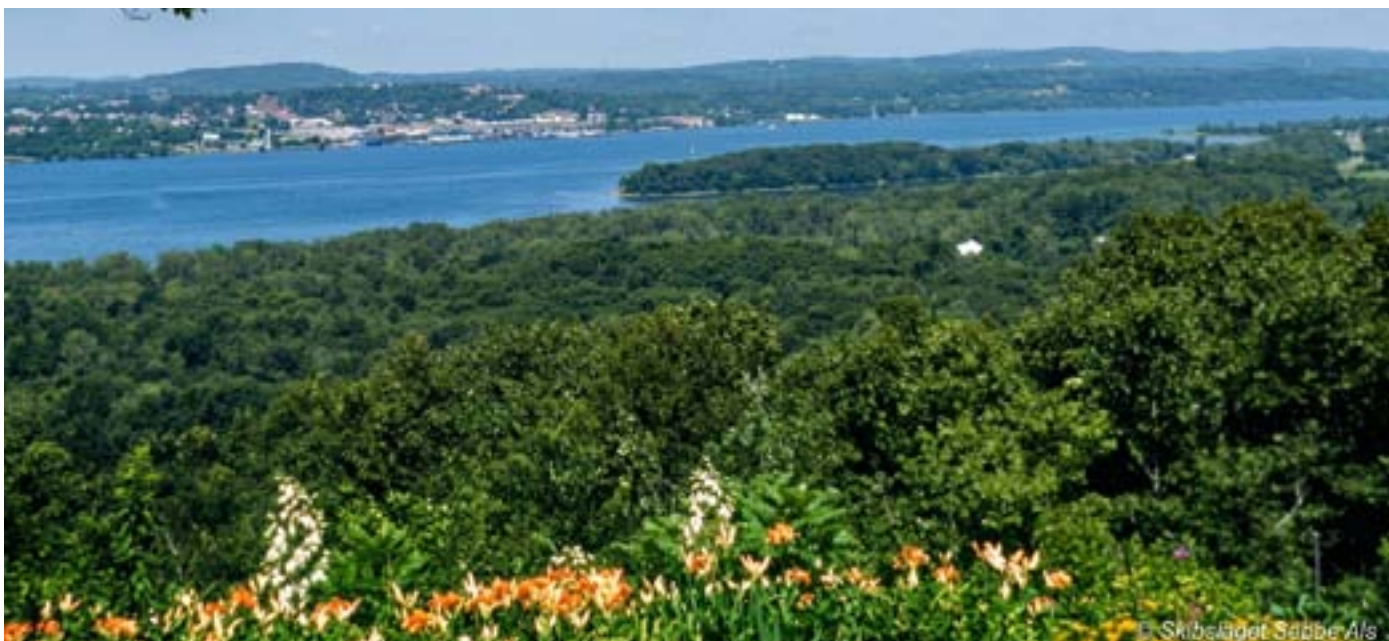
Udsigten fra Pete's hus