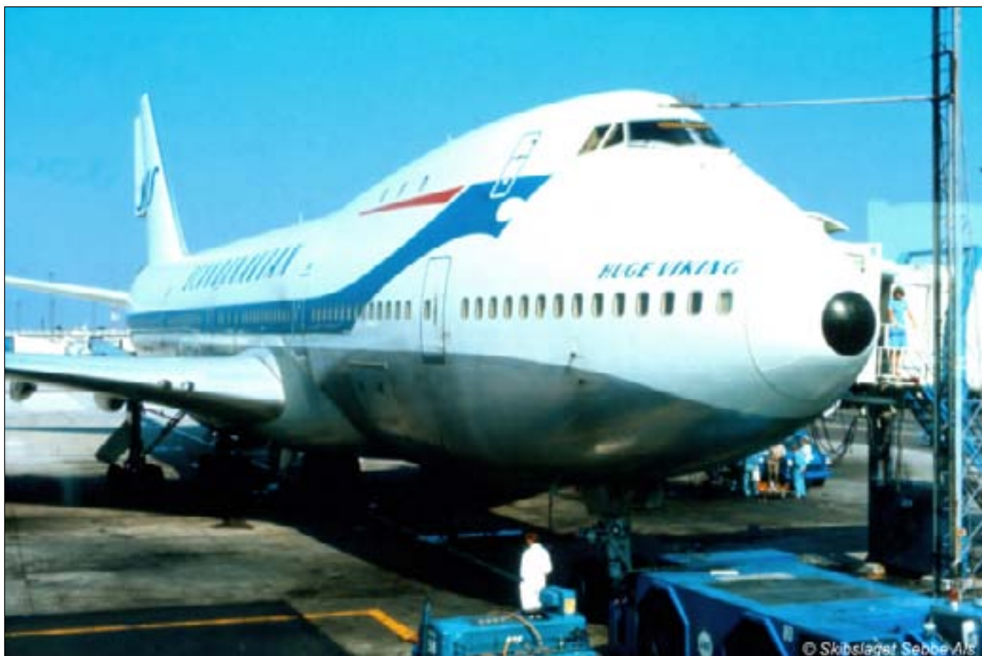
Turen med Jumbo jet fra Kastrup til New York