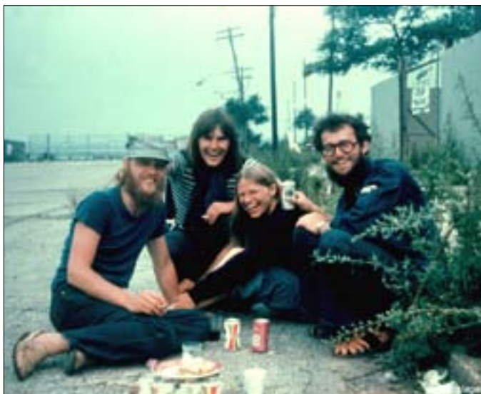
Vitsens venner holdt fortovs møde

Nogle indenfor - andre udenfor. Vi kunne få bad i en stor sportshal tæt ved, SEBBE lå aflåst, og motoren, skjolde o.s.v. blev låst inde i et rum. Vi fik at vide, et det var et kriminelt kvarter med "Wild angels" efter mørkets frembrud o.s.v., så vi måtte sætte vagter til at passe på.