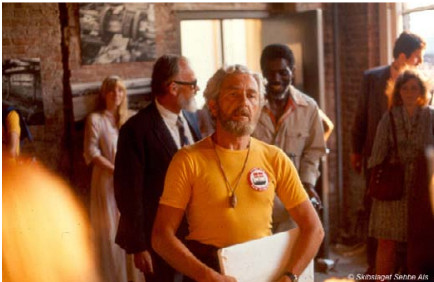
Her holder C. O. en af sine berømte præsidenttaler

Marine Museum til den officielle åbning af museet, og det var med diverse prominente personer, såsom borgmesteren og andre. Der var også her glas til alle og rigeligt til at hælde i det. Man gik rundt om og sludrede det bedste, man havde lært, og der var mange sproglige "guld-korn" at hente.