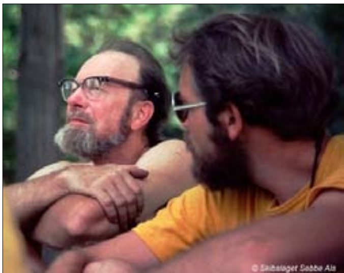
Hygge og afslapning

En del af os smed tøjet og tog et bad i det iskolde vand. Det var vanvittigt godt. da vi gik hjem igen, så vi et skilt på et træ.