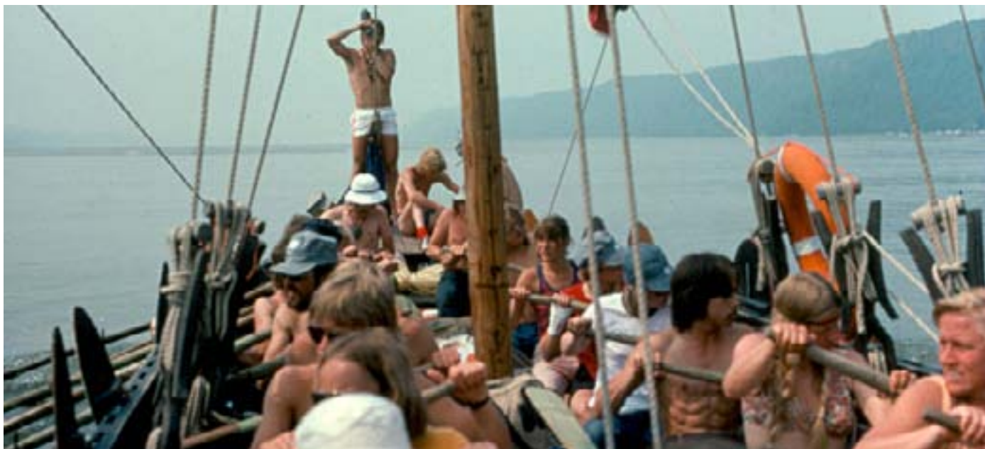
Ingen vind og roning