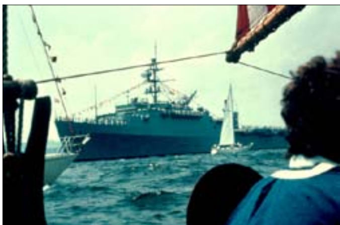
Vi følte os små mellem de store krigsskibe

Vi så PEDER SKRAM og kippede, men i forvirringen så de os ikke. Der var de mange lystbåde, der sejlede ind og ud mellem de deltagende skibe, der skabte forvirringen. Vi havde fin vind til sydspidsen af Manhattan, så pludselig drejede vinden 180°, og vi sejlede ind i et tordenvejr, og lyn-hurtigt måtte alle bjærge sejlene og sejle videre for motor. Vi sejlede meget tæt.