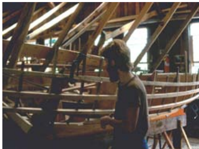
Så er skibet klat til at få monteret bordplanker.