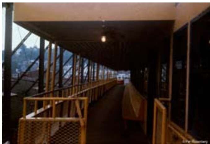
Færgen vi skulle overnatte på

Han var et fantastisk stort menneske med en udstråling, som betog os alle. KL. 22.30 gik vi ombord og trak 'broen' ind, snakkede lidt, men gik så til ro; vi skulle meget tidligt op næste morgen.