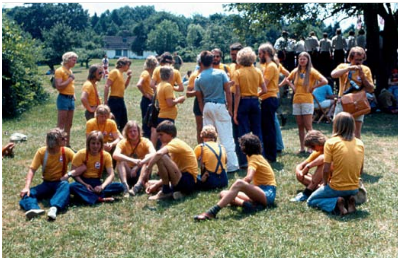
Afslapning under den dansk amerikanske "Rebildfest".