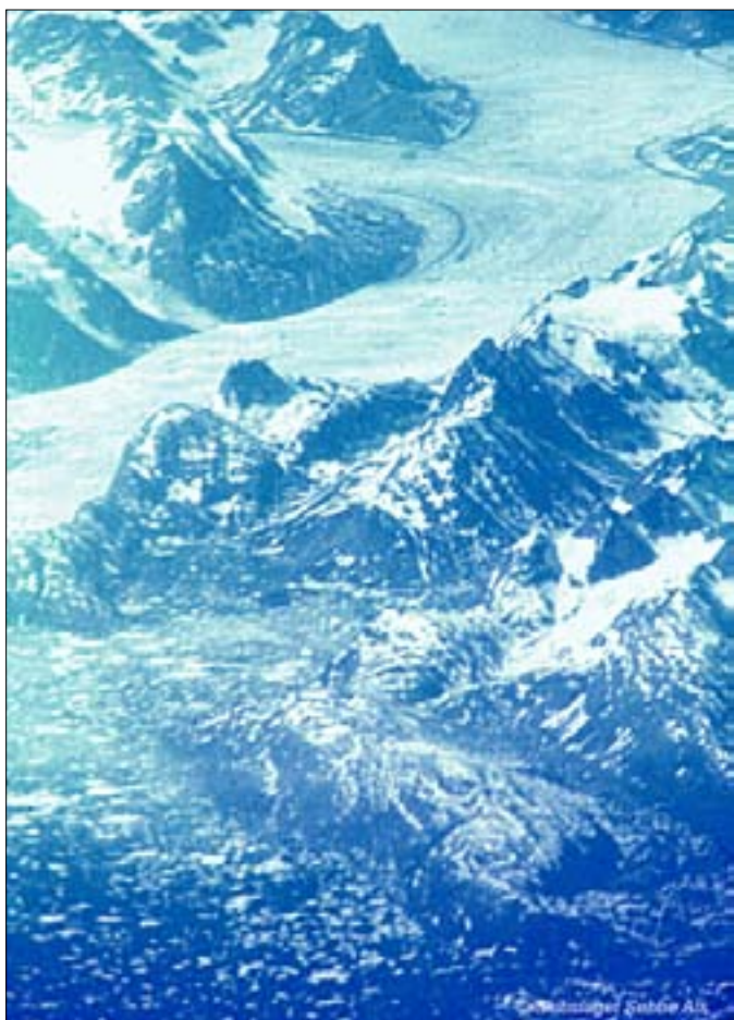
Grønland set fra flyet