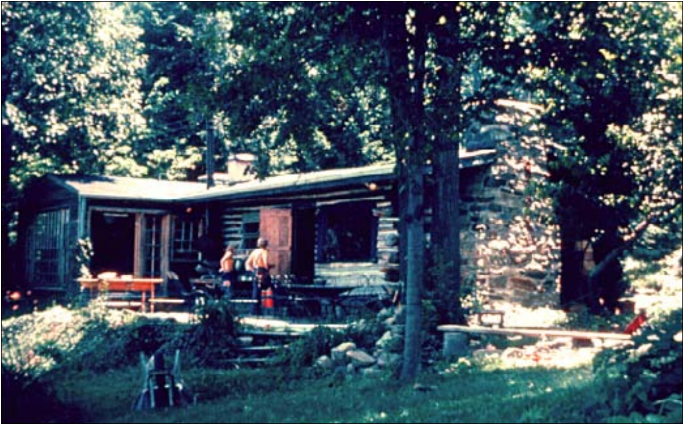
Pete og Toshi's hjemmebyggede hus