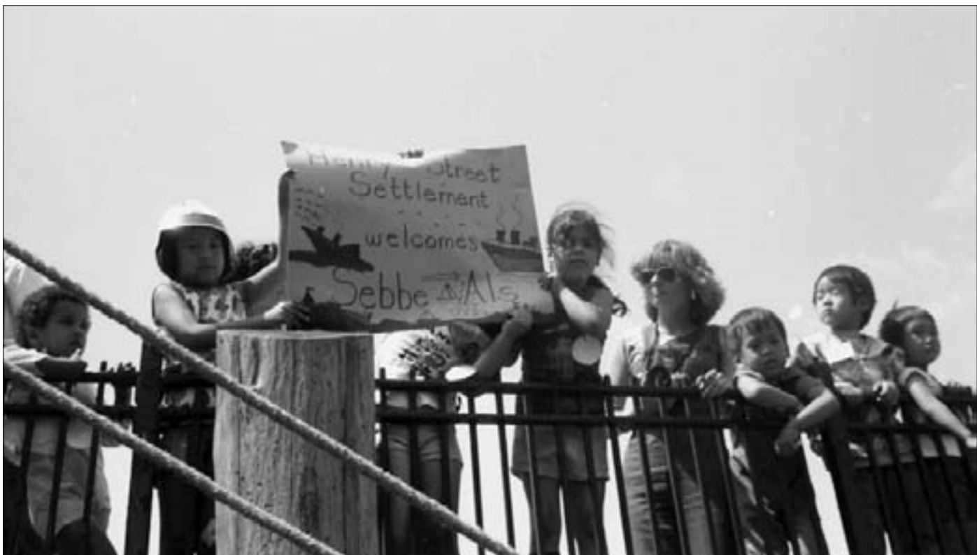
Børnene gav og en fin velkomst