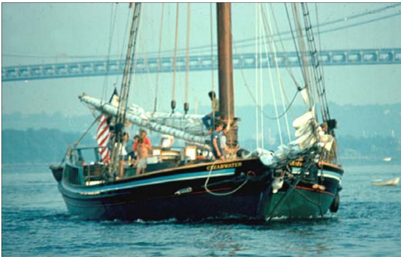
Vi sejlede ud for motor