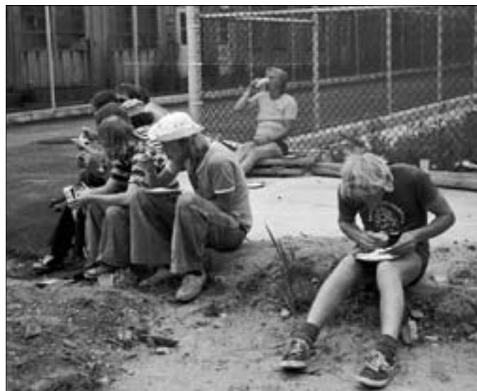
Kagen blev fortæret hvor der var en siddeplads

Man havde fået nys om, at det var C.O.'s fødselsdag, så de havde fået lavet en stor kage, typisk amerikansk med en masse kulørt sukkerstads og lys på, og bageren himself var mødt op for at skære den til.