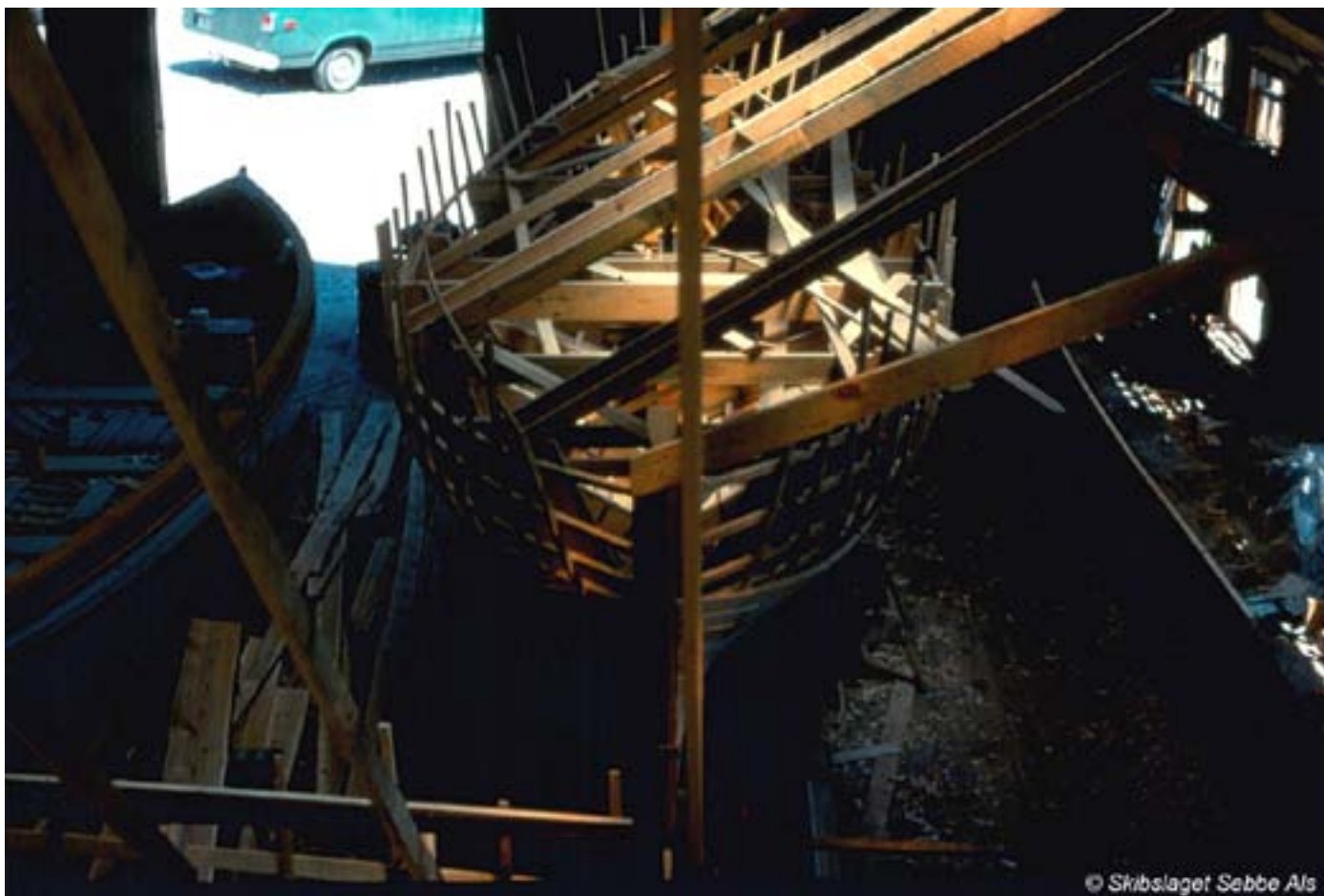
Morsomt at se træbåde blive bygget på gammel vis i Amerika

Han overrakte os en kuvert med 770 dollars, som han havde skrabet sammen gennem foredrag i Maine (stort område) og ved at skrive artikler om os og den måde, vi havde bygget skibet på. Han mente, det var vigtigt for skibslaget som helhed at have en stor opgave at samles om, og bad os til næste år gå i gang med et projekt, som C.O. havde omtalt, at vi havde i tankerne, men ingen midler til (en bådfæring med 8 årer, fordi som han sagde: 'Verden bliver bedre, når mennesker lærer et gøre ting sammen').