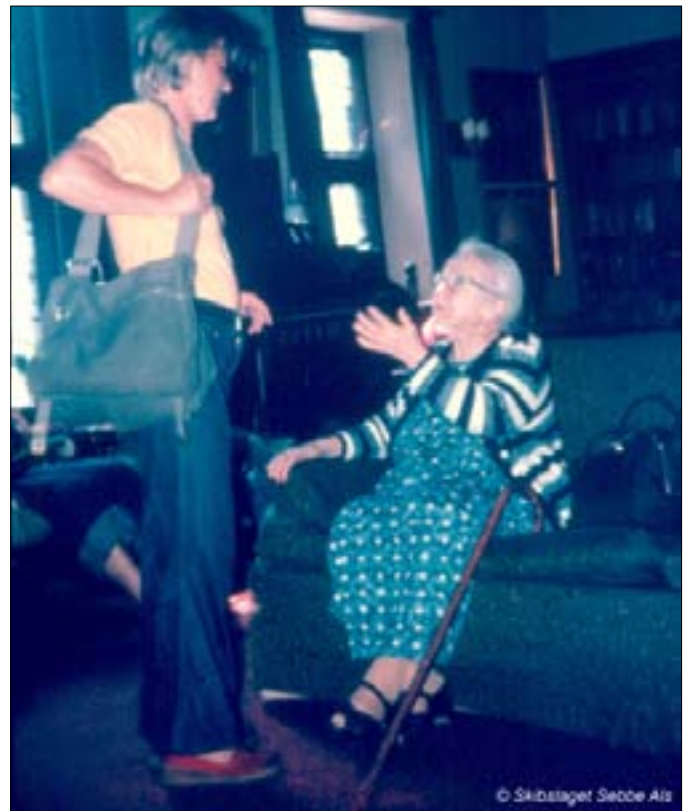
Den gamle dame fra Sønderborg

Det var ret imponerende, en af damerne var fra Sønderborg, en herre fra Haderslev og alle havde de meget at fortælle. Vi hentede dem rundt på stuerne og samledes så i en stor dagligstue, hvor vi sang danske fædrelands-sange, hvad de alle var meget glade for. Hist og her blev der nok fældet en lille tåre.