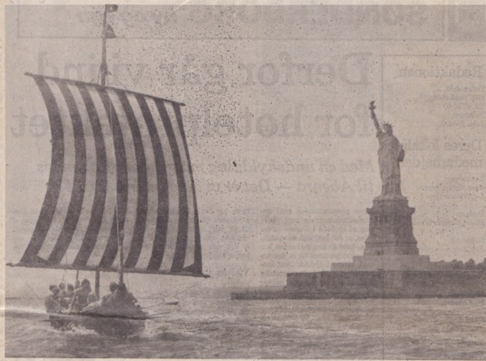
Sebbe Als passerer her Frihedsgudinden ved indsejlingen til New York. Et flot syn for de 30 alsinger.