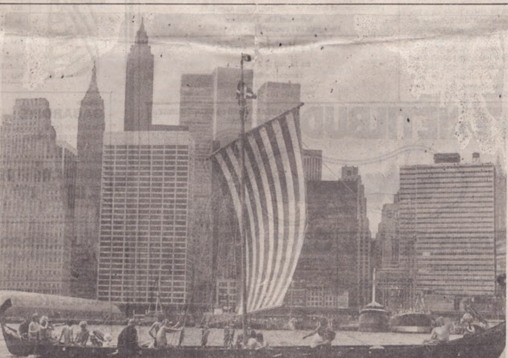
Sebbe Als sejlede flere gange gennem New York for fulde sejl, og der var meget at kigge på for sønderjyderne. Skyskraberne tårnede sig op, og endeløse rækker af havnekajer lå og forfaldt. Det nye container-system har næsten fuldstændigt fortrængt de gammeldags lossemetoder fra havnen i New York.