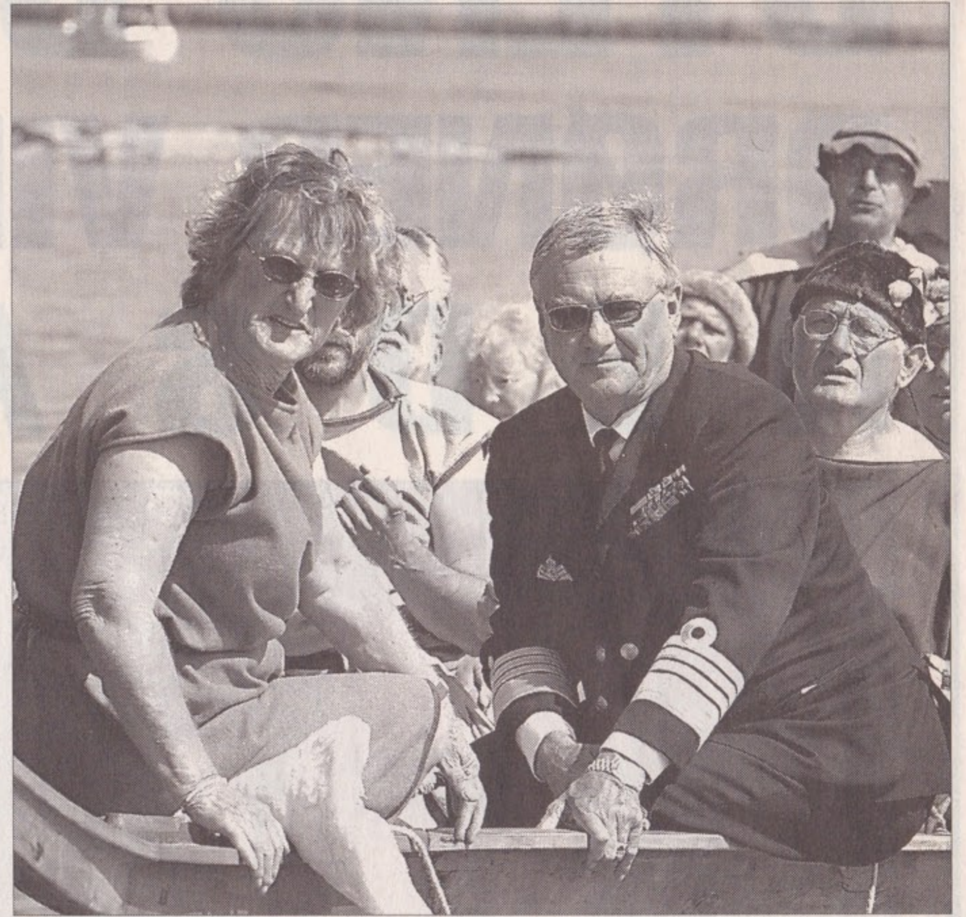
Til højre: Prins Henrik besluttede sig for at tage en tur i Hjortspringbåden.