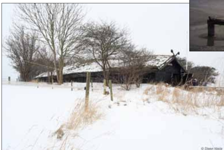
Nausten venter på foråret