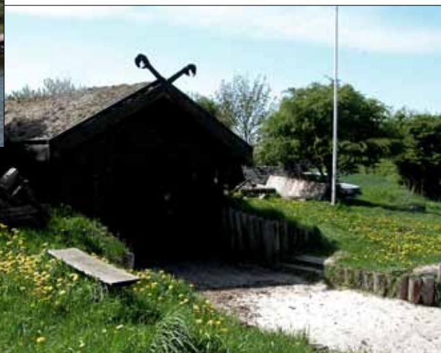
Nausten og mælkebøtter