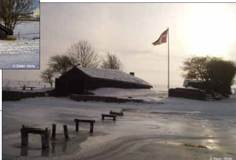
Nausten med sne og Dannebrog