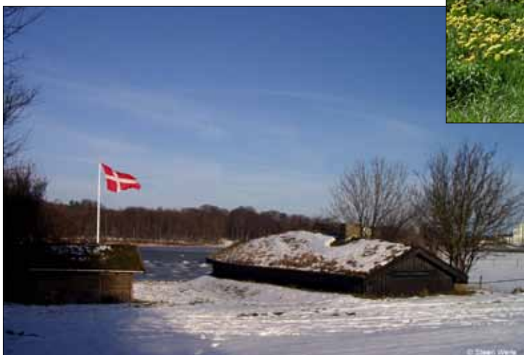
Nausten klædt i hvidt