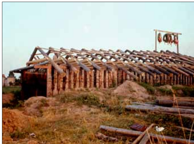
Rejsegilde på nausten 1973