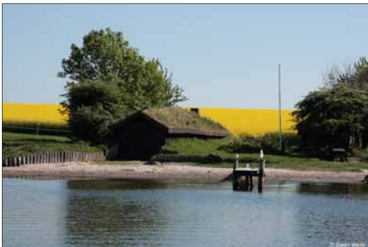
Nausten og blomstrende raps