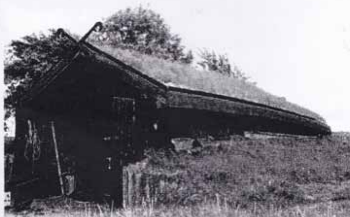
Nausten med sit nye græstag