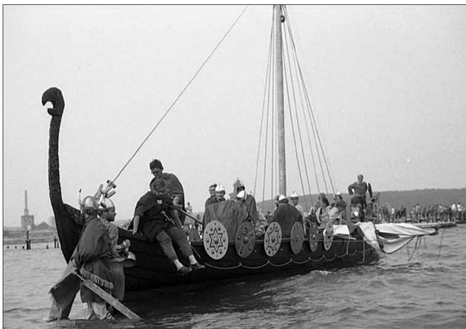
Billede fra Jomfruturen til Slesvig i 1969