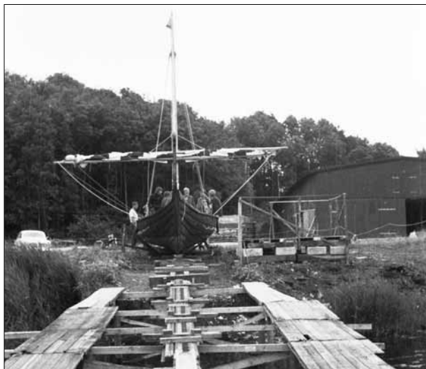
Sebbe 19. juli 1969