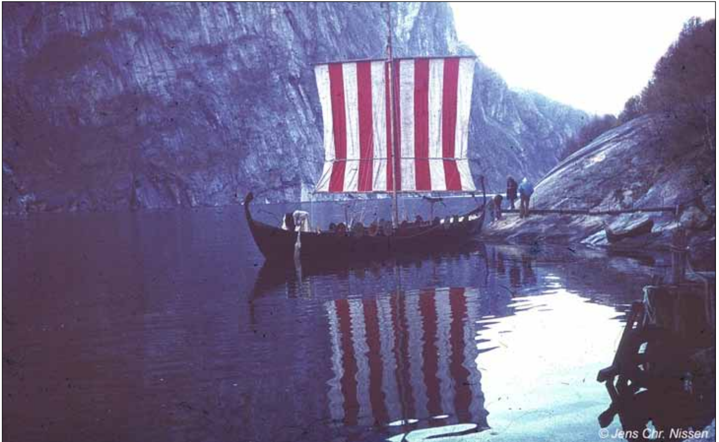
Fra optagelserne i Lysefjorden.

af bredden måtte de ikke køre på de store veje, men var henvist til små smalle snoede veje som det ses på billederne, hvilket gav store udfordringer. Skibet kom frem til Stavanger og blev hejst op på siden af en mindre færge som erstatning for 2 redningsbåde. De blev så sejlet til Lysefjorden hvor skibet blev søsat og optagelserne blev gennemført. (berettet af Finn Lassen)