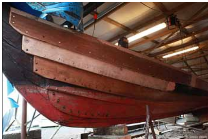
Forskibet, bagbord side