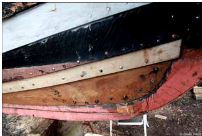
Forskibet, styrbord side