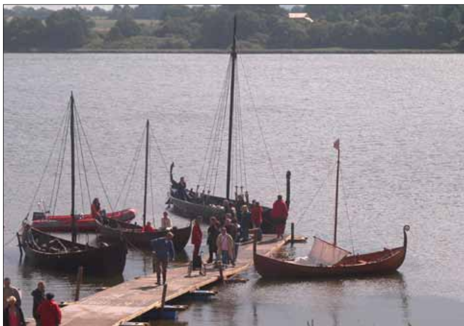
Smukt ser det ud når der ligger en flåde af vikingeskeibe. Foto fra Noret ved vikingemuseet i Slesvig.