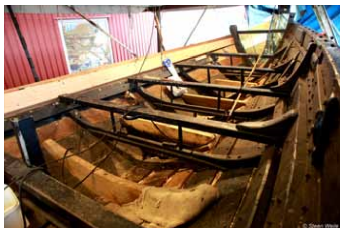
Reparationerne set indefra