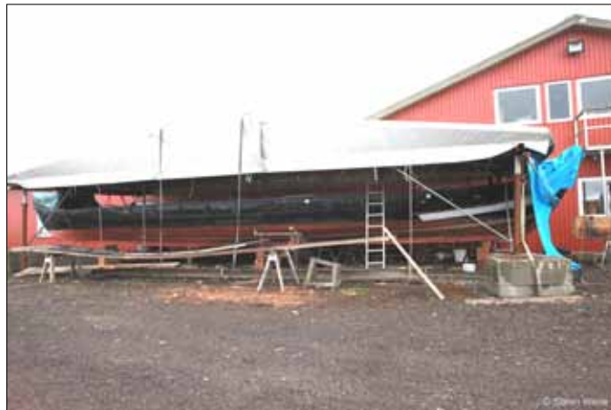
Skibet ligge i "telt" ved værftet