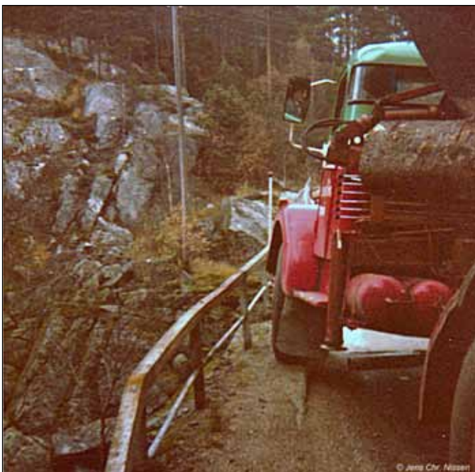
Vejene er bestemt ikke konstrueret til transport af vikingeskibe.