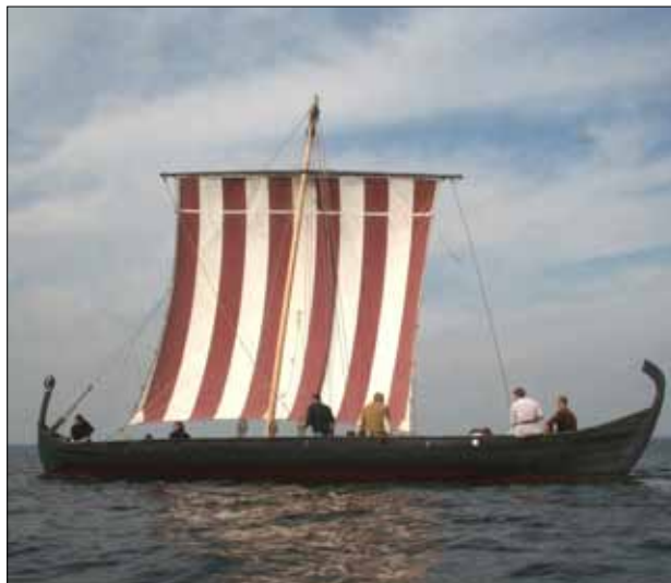
Sebbe i dag