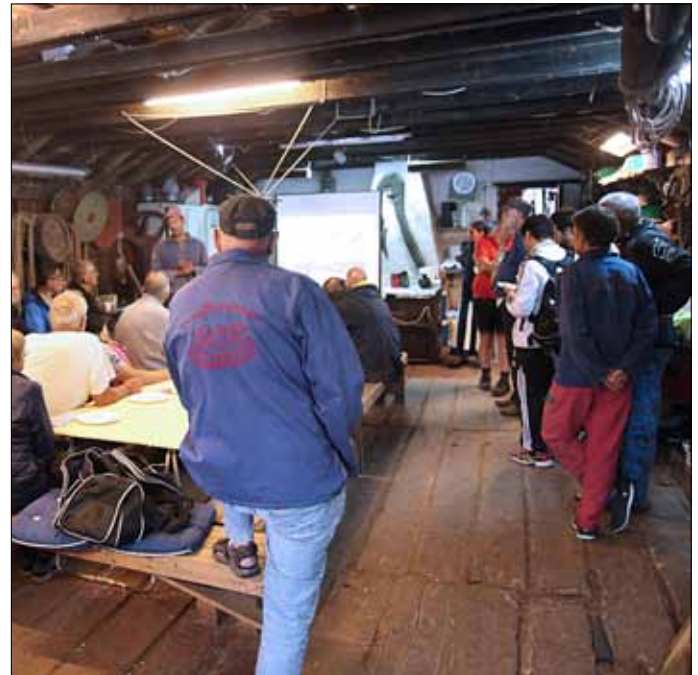
Åbent hus arrangementet 11. august i nausten