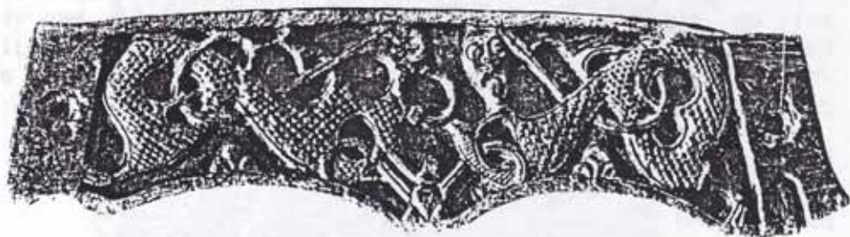
Dekorert trestykke (»spån») fra Osebergskipet. Sitter tværs over akterstavnen, like bak romannens hode.