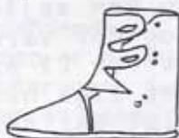
3.) høj støvle