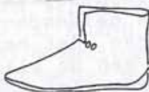
2.) Middelhøj Støvle