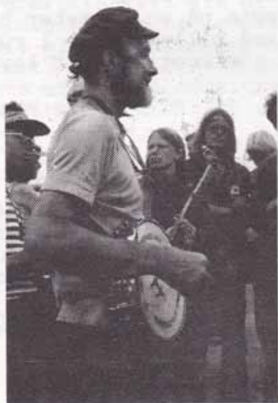
Pete Seeger på Staten Island