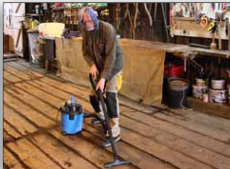
Putzfrau nr. 2 var meget grundig med rengøringen.