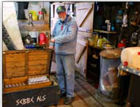
Putzfrau nr. 1 rengjorde en Sebbe kasse og lavede den om til BAR.