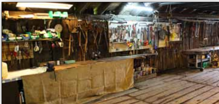
EFTER billede. Sådan skulle der gerne se ud.