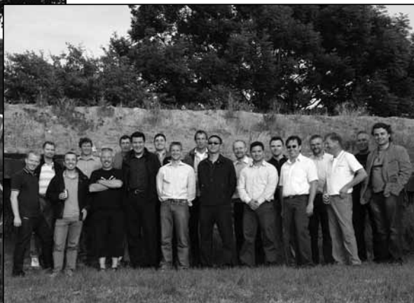
Gæsterne stillede op til gruppefoto

Grillen blev tændt med en stor gasbrænder