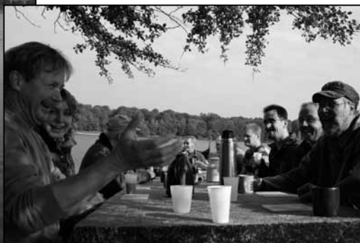
Hygge og morskab

Når mast og rigning er væk ses de bløde former