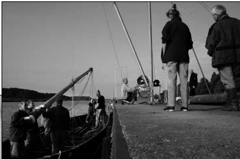
Masten lægges elegant ned