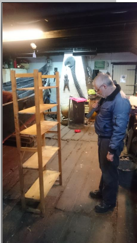
Skal den fikses eller ophugges?

Der var indkaldt til arbejdslørdag på Nausten, og der var lidt småregn og rusk uden for.