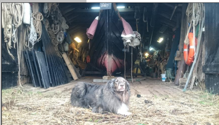
Der holdes vagt!

Der blev indtaget en hyggelig frokost, og herefter fortsatte dagens dont.