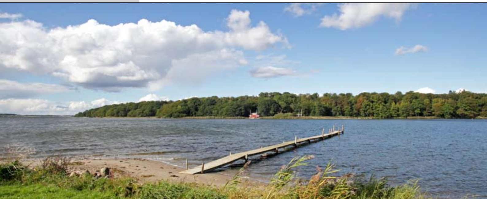
Efteråret begynder at farve skoven