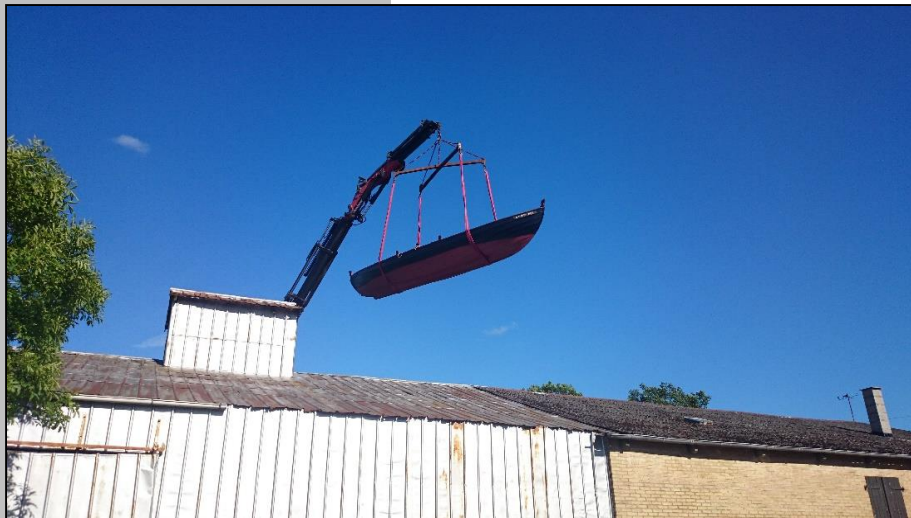
Er det en fugl? Er det et fly? Nej, det er Ottar, den flyvende færøbåd!